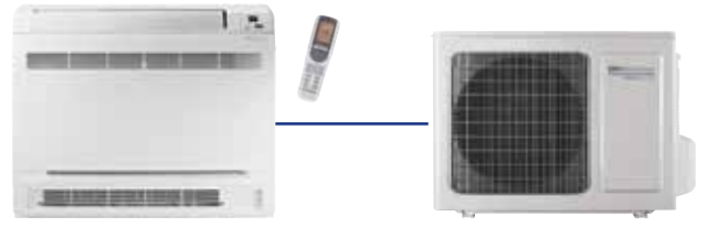
FEEL LINE mono Pavimento