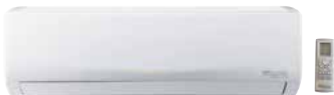
FEEL LINE multi Parete