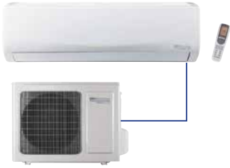
FEEL LINE mono Parete