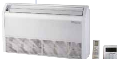
FEEL LINE multi Pav/Sof