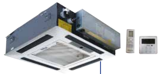
FEEL LINE multi Cassette