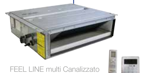
FEEL LINE multi Canalizzato