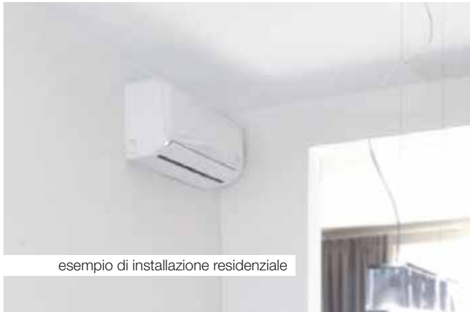
esempio di installazione residenziale

Grazie alla rete capillare di agenti, concessionari e centri tecnici assistenza, attivi su tutto il territorio nazionale e una presenza di rilievo nei principali mercati europei, ECA Technology vi da la possibilità di installare e mantenere il vostro climatizzatore ovunque voi siate.