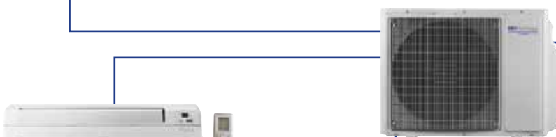
FEEL LINE multi Pavimento