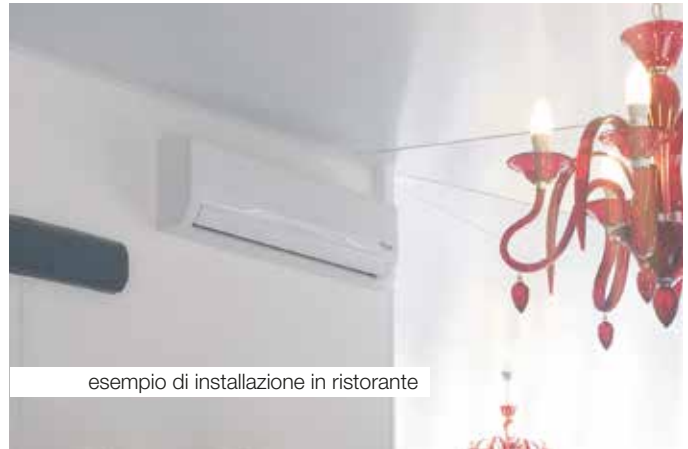
esempio di installazione in ristorante